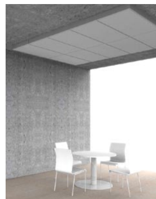
silentFOAM, dicht und homogen verlegt.

Absorbierende Fläche je 100 mm Pad: 1,134 m 2 , je 80 mm Pad: 1,062 m 2 .